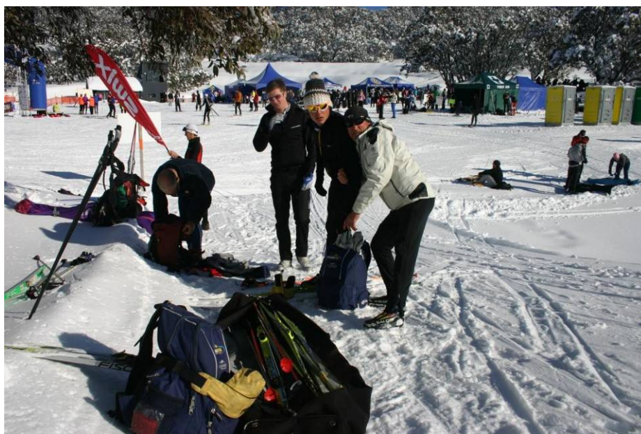
Стартовая поляна Нордик Боул (Nordic Bowl).

В день гонки, четвёртую субботу августа, всё внимание конечно же переносится на место старта. Все три гонки стартуют с Нордик Боул (Nordic Bowl) - уютная поляна, где участники и зрители вместе разделяют восторги праздника лыж.