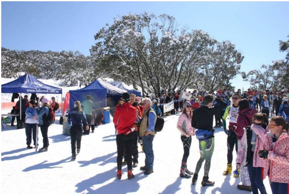
Гонщики и зрители на Nordic Bowl после Kangaroo Hoppet - 2010. В тот год погода позволяла не спешить расходиться...

После финиша здесь же, на Нордик Боул (Nordic Bowl), проводится короткая церемония награждения. Вручаются букеты цветов за 1, 2 и 3-е места по мужчинам и женщинам по всем дистанциям.